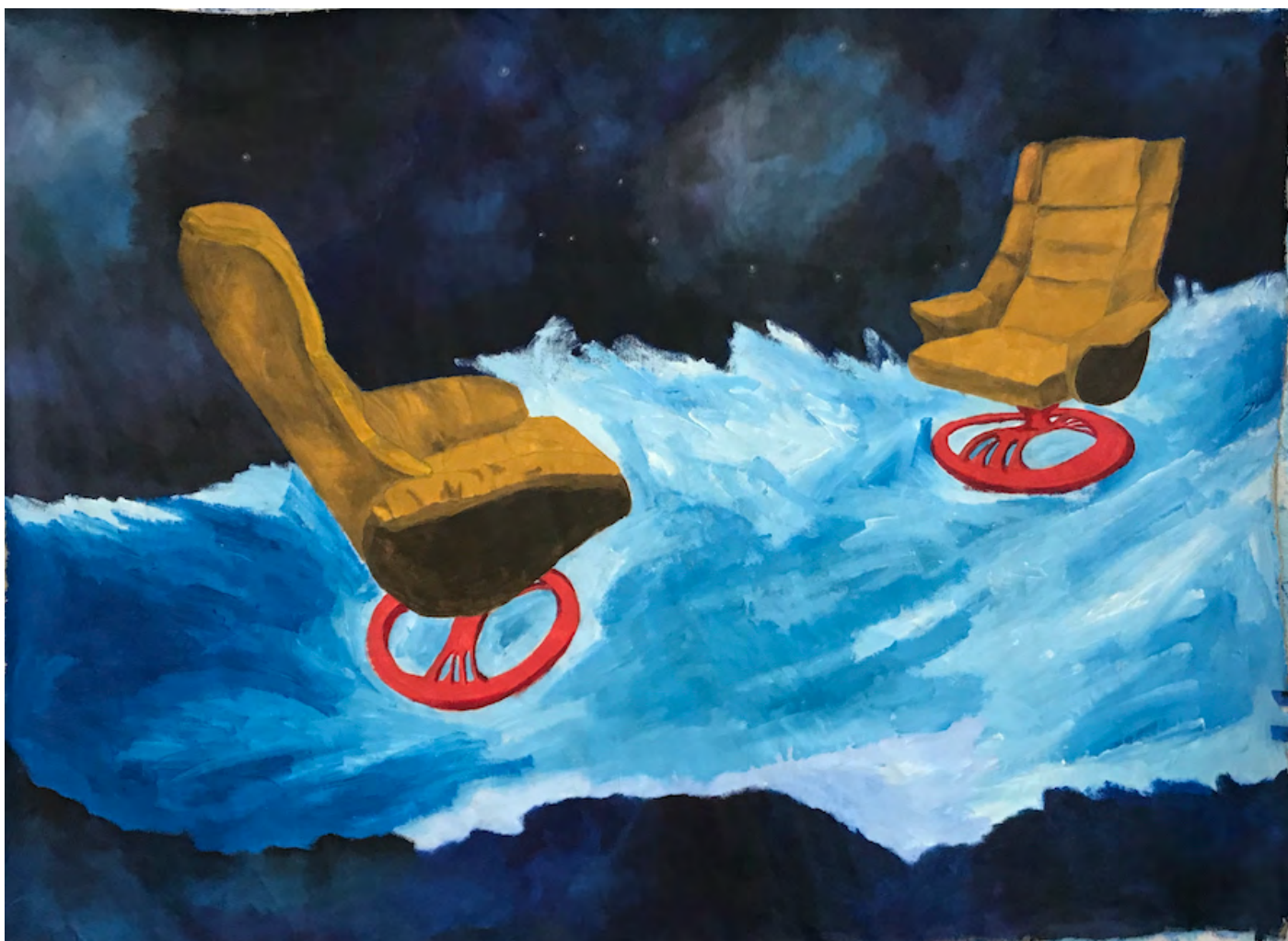
Enfermedad. Acrílico sobre tela de lienzo. 210 × 110