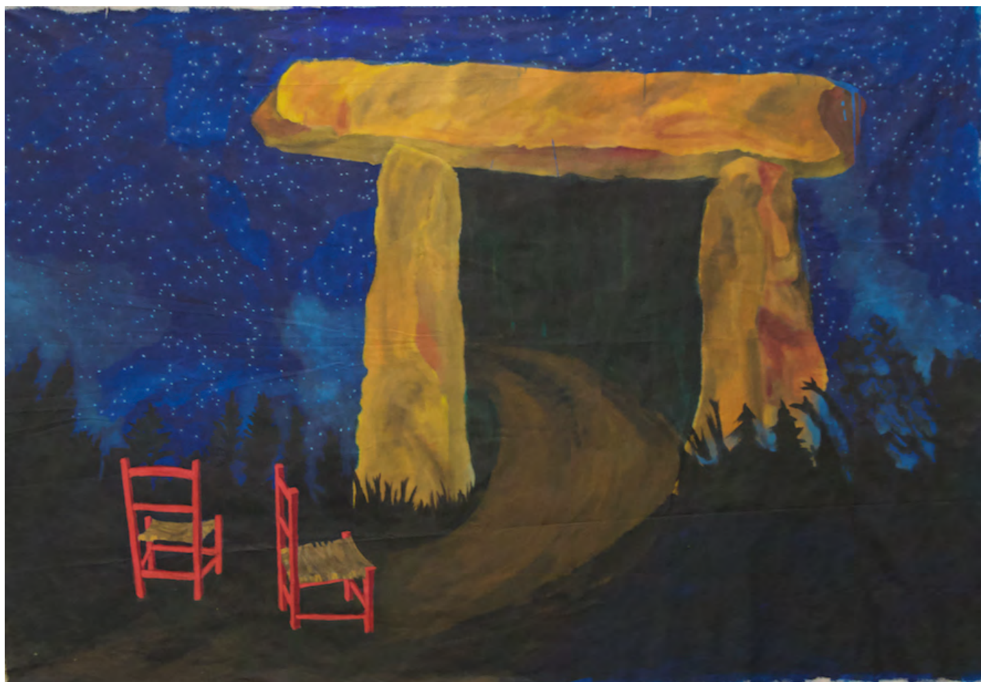
Línea de Fuga. Acrílico sobre tela de lienzo. 210 × 110