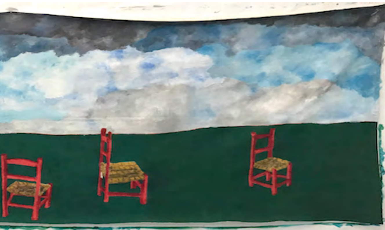
Movimiento. Acrílico sobre tela de lienzo. 150 × 90

Egonaldiaren helburua izan da Arteetan Oinarritutako Hezkuntza Ikerketari buruzko ikerketa bat egitea. Hezkuntzari buruzko ikerketa, artetik abiatuta. Zer topaketa eta elkarrizketa ahalbidetzen dute ikaskuntzari buruzko kontzeptuekin zerikusia duten pintura-lanek? Eraman gaitzake topaketak, obra eta kontzeptuetatik abiatuta, ezagutza sortzera? Zer ezagutza edo jakintza? Zer harreman eta afekzio sor daitezke? Arte-lanetik zenbait funtsezko ideia eta kontzeptu sortu dira, hala nola mugimendua, ihes-lerroa, natura, gorputza edo gaixotasuna. Mieke Bal-en lana erreferentzia gisa hartuta, erakusketa aukera bat izan daiteke artea bitartekari dituen topaketarako eta elkarrizketarako, kontzeptu horiei lotuta. Interesa daukat norabide horretan garatzen jarraitzeko.