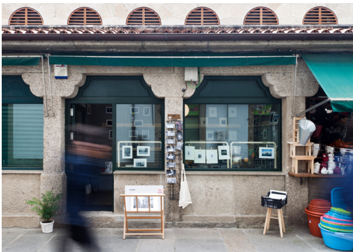
El espacio expositivo que Cuarto Pexigo dispone en el mercado de abastos de Santiago de Compostela.