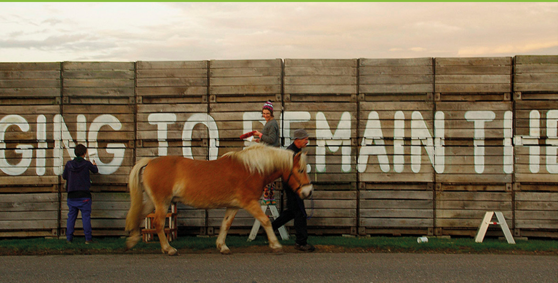
Annual harvest Future farmers - Limburg, Bélgica, 2014